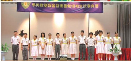
▲ 圖書館領袖生分組上台