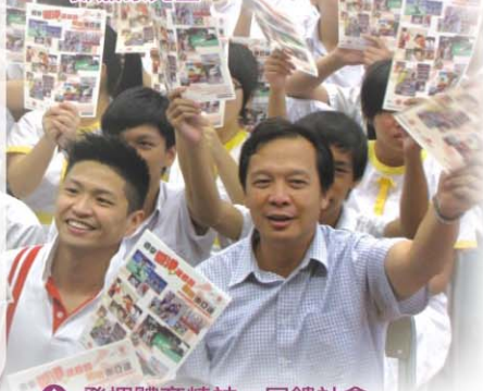
▲ 發揮體育精神，回饋社會