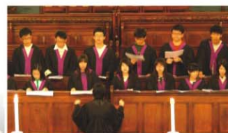
▲ 中環聖若翰座堂表演

本年度歌詠團的成員主要來自初中，手鈴隊亦由全新成員組成，為了維持過往演出水準，老師和同學都願意付出課餘時間加緊排練。三場演出，雖則對象不同，兩隊同學均用心演繹樂章。悠揚的樂章，伴以同學的笑臉，為坊眾帶來暖意盎然的節日祝福。