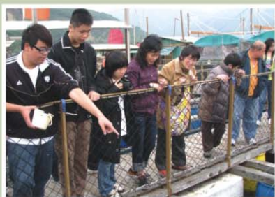
漁民介紹捕魚業發展歷程

為增加家長與子女的溝通和接觸機會，培養親子和諧關係，學校與家長教師會聯合舉辦一項名為「南丫島海鮮宴一天遊」的活動。