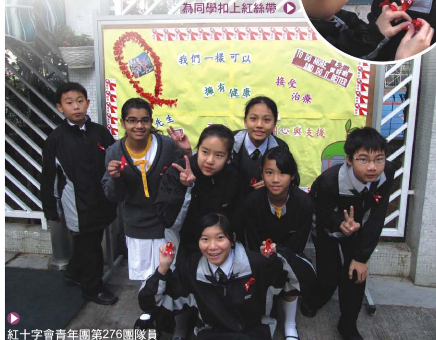
▶ 紅十字會青年團第276團隊員