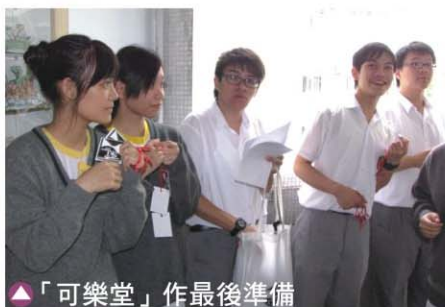
▲「可樂堂」作最後準備