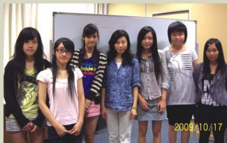
▲ 圖書館領袖生與資深編輯—余非合照

於二零零九年十月十七日，中六級的圖書館領袖生參與了香港閱讀城舉辦的中學生閱讀大使培訓工作坊。是次活動由余非主持，她是資深編輯，業餘更熱愛從事文藝寫作。在她細心的指導下，同學們學會如何選擇一本好書，再而深入閱讀，仔細分析。閱讀一本書看似簡單，只是從頭看到尾，但這樣的閱讀方式，只是為閱讀而閱讀，尋找不到閱讀的趣味性。閱讀啟發思維，從中要吸收作者的識見，感受與態度，嘗試分析文章的語句修飾，不同表達的方式。不同層次的閱讀更有助提升閱讀理解及欣賞的能力。參與是次活動後，同學們明白到閱讀是深入理解分析，透過同學之間的閱讀分享，閱讀能力才能逐漸提高。所以，在接受閱讀大使培訓後，同學們將會組織校園讀書會，給予同學更多的機會交流彼此的閱讀心得，積極推廣校園的閱讀風氣。讀書會將會在11月熱烈展開，期望同學們踴躍參與。