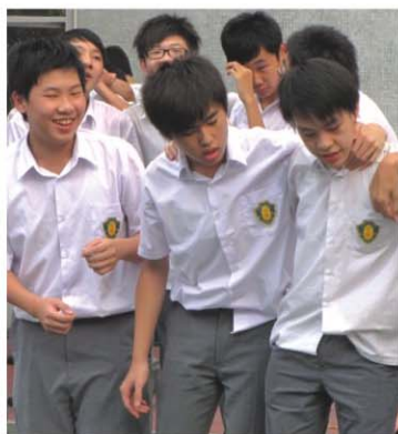
▲ We are ready! ▲