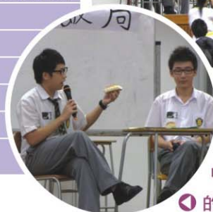
▲「熱久飯局」介紹他們的工作