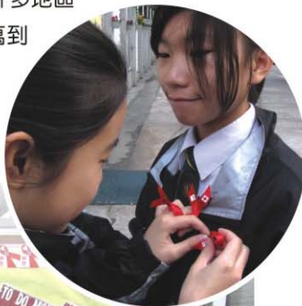
▶ 為同學扣上紅絲帶

世界愛滋病日的標誌是紅絲帶，表示對HIV陽性者及與他們共同生活者的關懷與接納，並團結一致對抗愛滋。