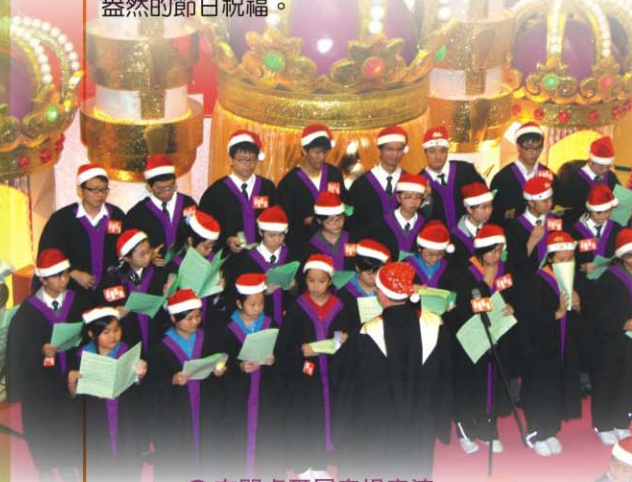
▲ 屯門卓爾居商場表演