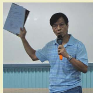
▲ 校長講解有關政策

10月2日本校進行了第一次教師發展日。上午環節為中文大學-優質學校改進計劃工作坊，主題為「可圈可點、可藝省思」。工作坊由中文大學學校發展主任負責，為全校教師提供一個反思學校文化的機會。而下午環節為校內討論，主題為恆常考績評估-各組別評核準則及全校語文政策。