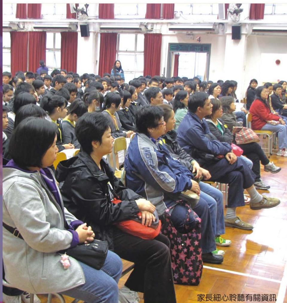
家長細心聆聽有關資訊

在新高中學制下，有意接受主流教育的學生，應可在同一學校完成六年中學教育，以確保學習的連貫性。本校有條件提供足夠的中四學位收納所有原校中三的學生。