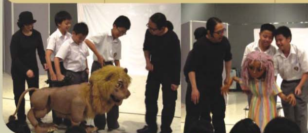
▶ 獅子也由同學的指揮