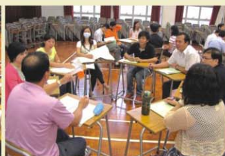
▲ 中文大學優質學校改進計劃成員