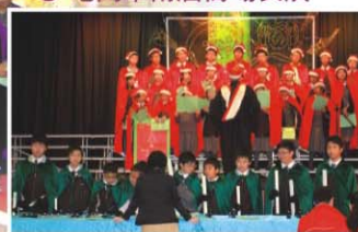
▲ 中華基督教會蒙黃花沃小學表演