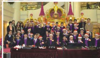
▲ 屯門卓爾居商場表演