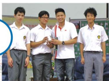
▲ 學生代表致送紀念品予鄭嘉豪先生

邀得鄭嘉豪先生作講座嘉賓。鄭先生運動技術出眾，曾多次代表香港武術隊在不少國際性比賽上摘取獎牌；亦曾獲「香港傑出運動員獎」及「行政長官社區服務獎狀」。鄭先生在得獎之餘，還樂意將自己當運動員的心路歷程與其他後進分享，希望將體育精神傳揚出去，回饋社會。