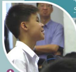
▲ 現場同學提問有關訓導事項